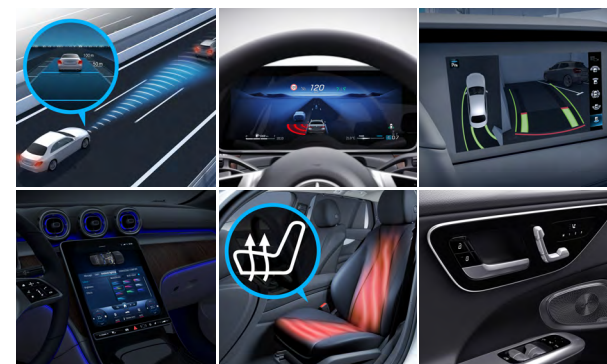
Edition AMG Line