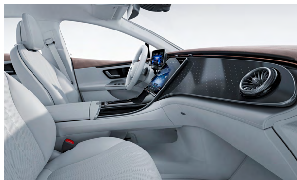
Electric Art Interior