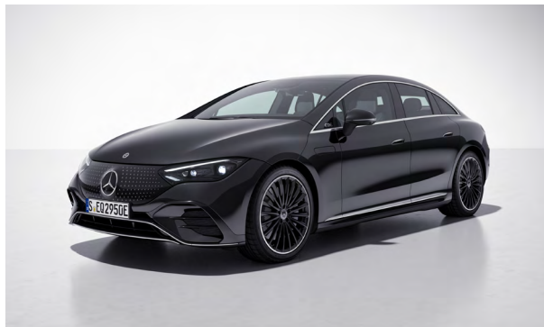
AMG Line Exterieur

Einfaches Laden: immer und überall. Das flexible Ladesystem Pro garantiert sicheres Laden an allen gängigen Stromquellen mit bis zu 22 kW 1 und zeigt an, wie viel Strom bereits geladen wurde. Die elektrische Fahrzeugsteckdosenklappe öffnet per Tastendruck und schließt nach Abziehen des Lade Steckers bequem automatisch.