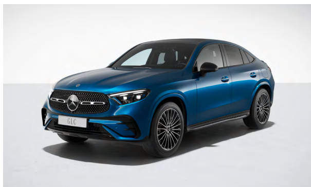
AMG Line Exterieur

GUARD 360° Fahrzeugschutz Plus garantiert eine effektive Rundumüberwachung inklusive Einbruch- und Diebstahlwarnanlage sowie Abschleppschutz und Kollisionserkennung.