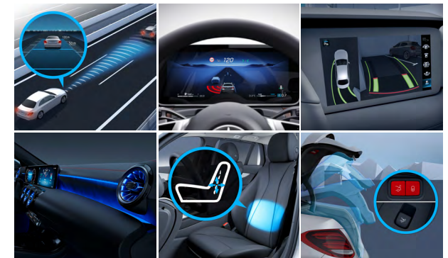
Edition Progressive Line