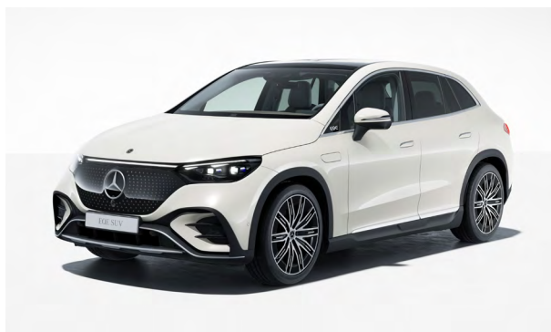
AMG Line Exterior

Einfaches Laden: immer und überall. Das flexible Ladesystem Pro garantiert sicheres Laden an allen gängigen Stromquellen mit bis zu 22 kW und zeigt an, wie viel Strom bereits geladen wurde. Die elektrische Fahrzeugsteckdosenklappe öffnet per Tastendruck und schließt nach Abziehen des Lade Steckers bequem automatisch.