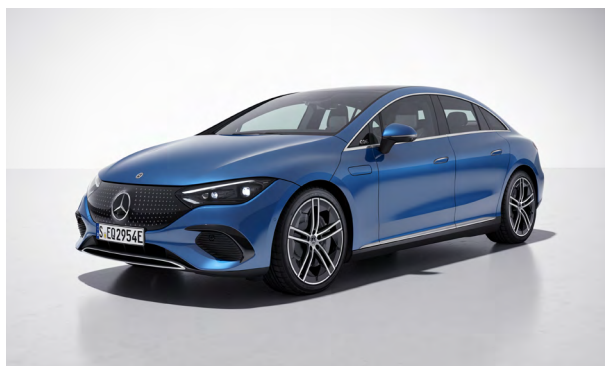
Electric Art Exterior

Einfaches Laden: immer und überall. Das flexible Ladesystem Pro garantiert sicheres Laden an allen gängigen Stromquellen mit bis zu 22 kW 1 und zeigt an, wie viel Strom bereits geladen wurde. Die elektrische Fahrzeugsteckdosenklappe öffnet per Tastendruck und schließt nach Abziehen des Lade Steckers bequem automatisch.