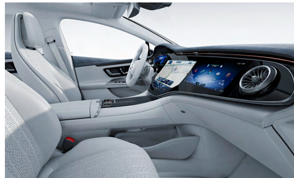
AMG Line Interieur