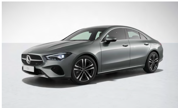
Progressive Line Exterior

PARKTRONIC und 360°-Kamera werden freie Parklücken und markierte Parkplätze im Vorüberfahren erkannt. Das Einparken erfolgt dann souverän dank dynamischer Visualisierung und akustischer Rückmeldung durch den Fahrer selbst – oder assistiert durch das Fahrzeug. Der Aktive Abstands-Assistent DISTRONIC regelt sowohl im fließenden als auch in stockendem Verkehr den Abstand zum vorausfahrenden Fahrzeug, passt die Fahrgeschwindigkeit an Streckenereignisse an und übernimmt das anstrengende Folgefahren im Kolonnenverkehr oder Stau. Der Verkehrszeichen-Assistent kann dank intelligenter Verknüpfung von Kamera- und Kartendaten nicht nur Geschwindigkeitsbegrenzungen, Überholverbote und deren Aufhebung erkennen. Er zeigt auch Einfahrverbote an und warnt vor Falscheinfahrt.