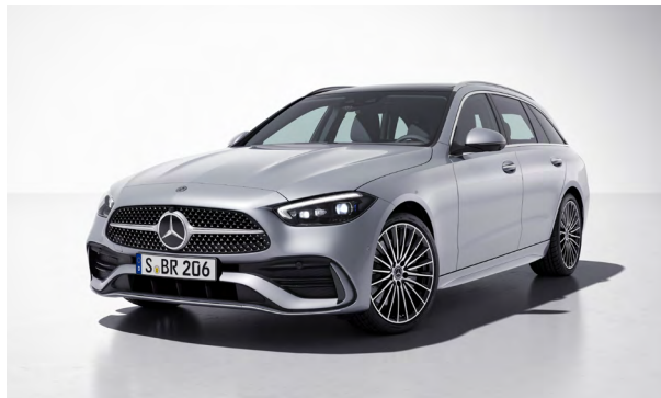
AMG Line Exterieur

GUARD 360° Fahrzeugschutz Plus garantiert eine effektive Rundumüberwachung inklusive Einbruch- und Diebstahlwarnanlage sowie Abschleppschutz und Kollisionserkennung.