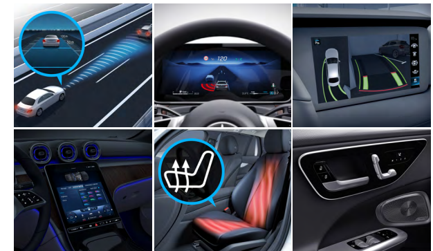
Edition AMG Line