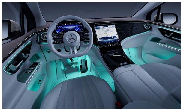
AMG Line Interieur