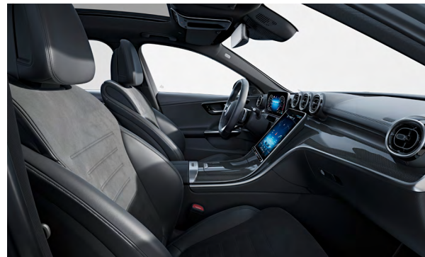
AMG Line Interieur