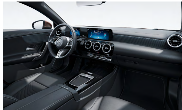
Progressive Line Interieur