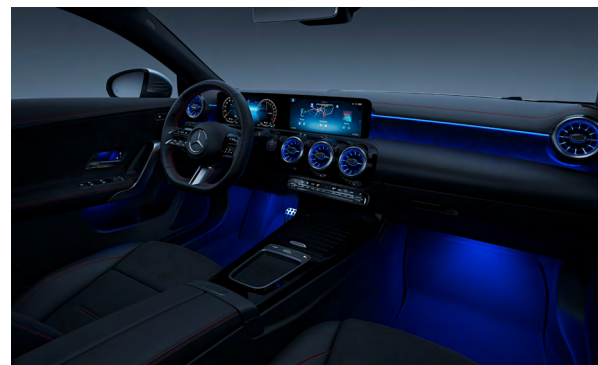
AMG Line Interieur