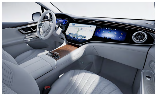
Electric Art Interieur