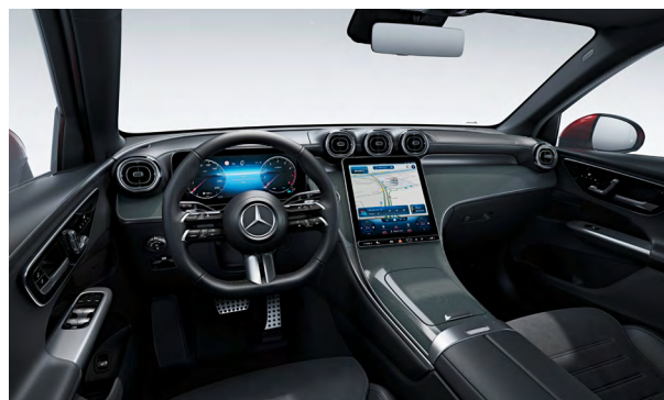
AMG Line Interieur