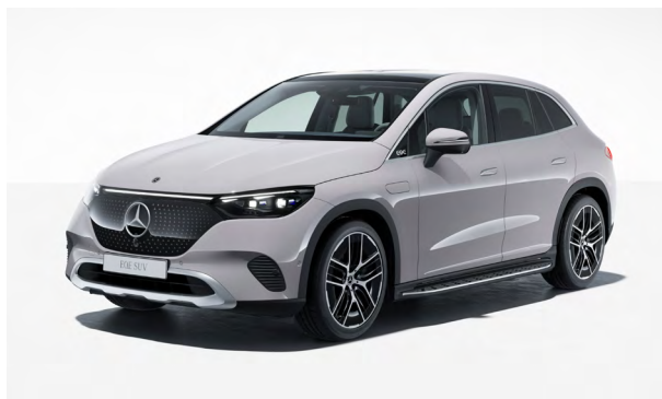
Electric Art Exterior

Einfaches Laden: immer und überall. Das flexible Ladesystem Pro garantiert sicheres Laden an allen gängigen Stromquellen mit bis zu 22 kW und zeigt an, wie viel Strom bereits geladen wurde. Die elektrische Fahrzeugsteckdosenklappe öffnet per Tastendruck und schließt nach Abziehen des Lade Steckers bequem automatisch.