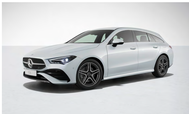
AMG Line Exterior

erkannt. Das Einparken erfolgt dann souverän dank dynamischer Visualisierung und akustischer Rückmeldung durch den Fahrer selbst – oder assistiert durch das Fahrzeug. Der Aktive Abstands-Assistent DISTRONIC regelt sowohl im fließenden als auch in stockendem Verkehr den Abstand zum vorausfahrenden Fahrzeug, passt die Fahrgeschwindigkeit an Streckenereignisse an und übernimmt das anstrengende Folgefahren im Kolonnenverkehr oder Stau. Der Verkehrszeichen-Assistent kann dank intelligenter Verknüpfung von Kamera- und Kartendaten nicht nur Geschwindigkeitsbegrenzungen, Überholverbote und deren Aufhebung erkennen. Er zeigt auch Einfahrverbote an und warnt vor Falsch Einfahrt.